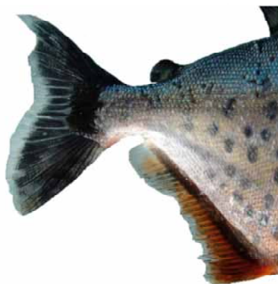
Figura 2. Fotografía en detalle de la región anal y caudal mostrando el patrón particular de coloración y banda de escamas (flecha) sobre la aleta anal.